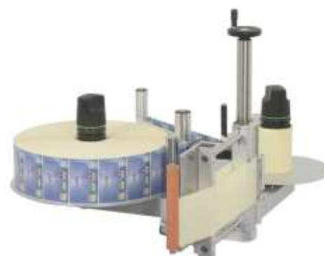
Levé provedení - horizontální